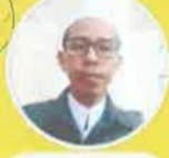
UST KHOLID AR